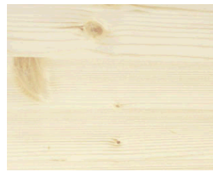
Naturel blanchi N° 802-92

Cette feuille d'information est produite en utilisant des techniques d'impression; les couleurs peuvent dévier des tons d'origine.