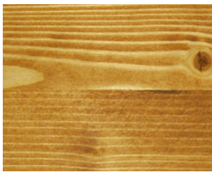
Teak N° 802-81

Comme pour toutes les peintures et revêtements, l'huile de mobilier de jardin se conserve dans son emballage d'origine dans un endroit sec, bien fermé, au frais mais à l'abri du gel et hors de portée des enfants. Conservé ainsi, nous garantissons une conservation de 24 mois. La peinture peut aussi être utilisée une fois cette date dépassée, mais il faut faire un test avant de l'utiliser. Comme pour toutes les peintures et vernis, il faut prendre des mesures de protection lorsqu'on applique ces huiles, et veiller particulièrement à une aération suffisante et une protection de la peau.